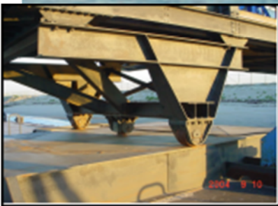
Vast draaipunt brug